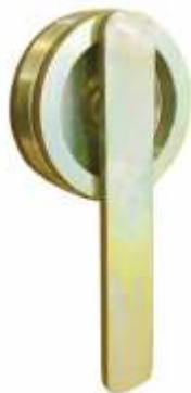
Рисунок 42 - Заглушка на штуцер РУП

Таблица 65. Артикулы заглушки на штуцер РУП.